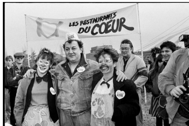
Coluche pose avec deux bénévoles devant l'entrée du Restaurant du Cœur à Gennevilliers pour l'inauguration d'un des trois Restaurants du Cœur de la région parisienne, le 21 décembre 1985.