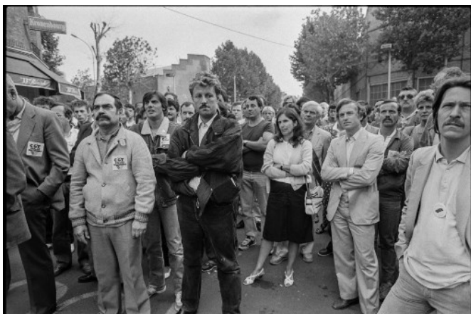
Des ouvriers de la Régie Renault de Boulogne-Billancourt manifestent le 8 août 1986 devant le siège de l'entreprise contre les mesures de licenciement annoncées.