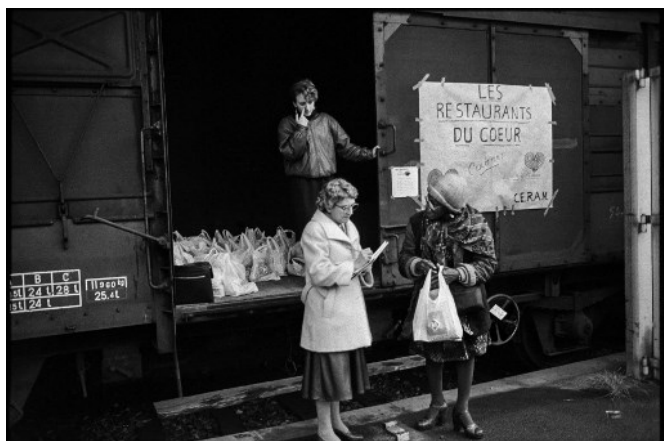
Des bénévoles des Restos du Cœur distribuent des sacs de nourriture depuis un wagon de la SNCF à Cannes, le 29 décembre 1985.

Après Paris, l'exposition se tiendra dans plusieurs autres grandes villes de France, chacune importante dans l'histoire des Restos du Cœur.