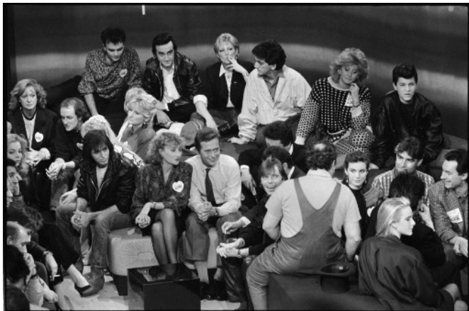
De nombreuses personnalités participent à l'émission télévisée de TF1 pour les Restaurants du Cœur organisée par son fondateur Coluche (de dos), à Paris le 26 janvier 1986.